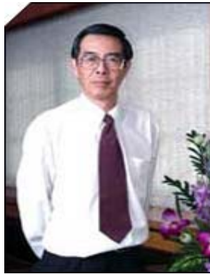
รศ.ดร.วิจิต หล่อจิระชุนห์กุล