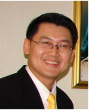
อ.พ.ต.ท.ดร.เกษมสถานต์ โขติชาครพันธุ์